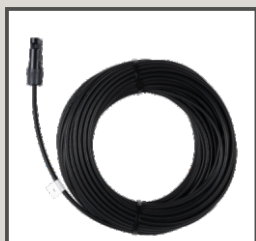
30 M CABLE CON CONECTOR MC4